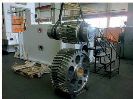
Vista coppia bielicoidale realizzata da Colzani Ingranaggi.